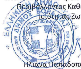
Ηλιάννα Παπαδοπούλου Τοπογράφος Μηχανικός με β. Α'

Η Αναπληρώτρια προϊσταμένη της Δ/σης Περιβάλλοντος Καθαριότητας και Ποιότητας Ζωής