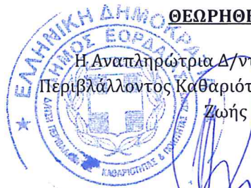
ΗΛΙΑΝΑ ΠΑΠΑΔΟΠΟΥΛΟΥ Τοπογράφος Μηχανικός με Α' β.

Η Αναπληρώτρια Δ/ντρια της Δ/νσης Περιβάλλοντος Καθαριότητας και Ποιότητας Ζωής